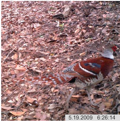
(A) 白颈长尾雉(雄) Syrmaticus ellioti