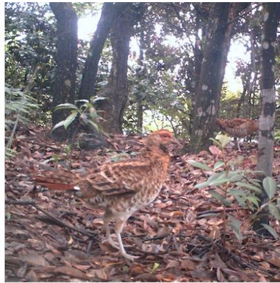
(B) 白颈长尾雉(雌) Syrmaticus ellioti