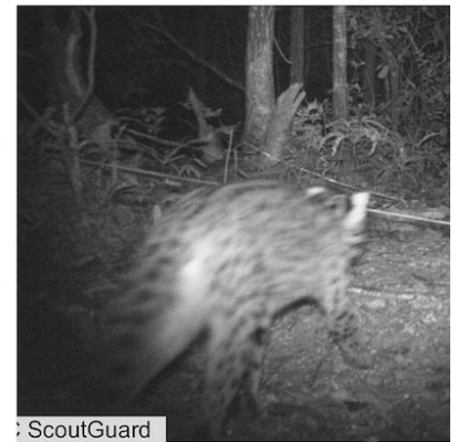
(F) 豹猫 Prionailurus bengalensis