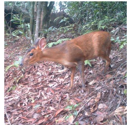
(I) 黄麂 Muntiacus reevesi