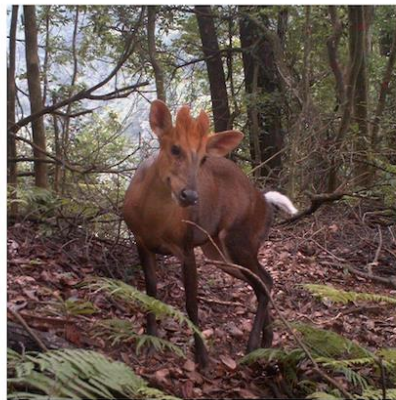
(H) 黑麂 Muntiacus crinifrons