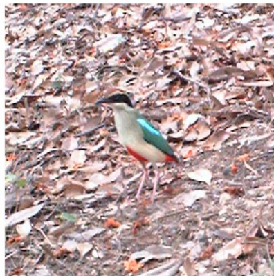
(E) 仙八色鸫 Pitta nympha