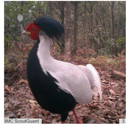
(C) 白鹇(雄) Lophura nycthemera