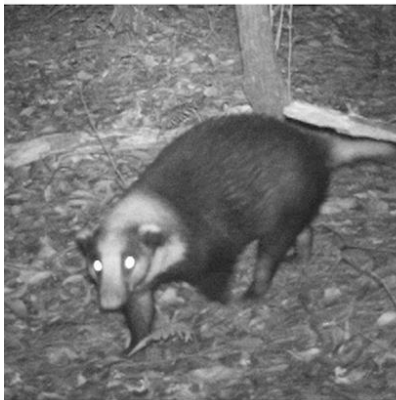
(G) 猪獾 Arctonyx collaris