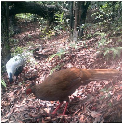
(D) 白鹇(雌) Lophura nycthemera