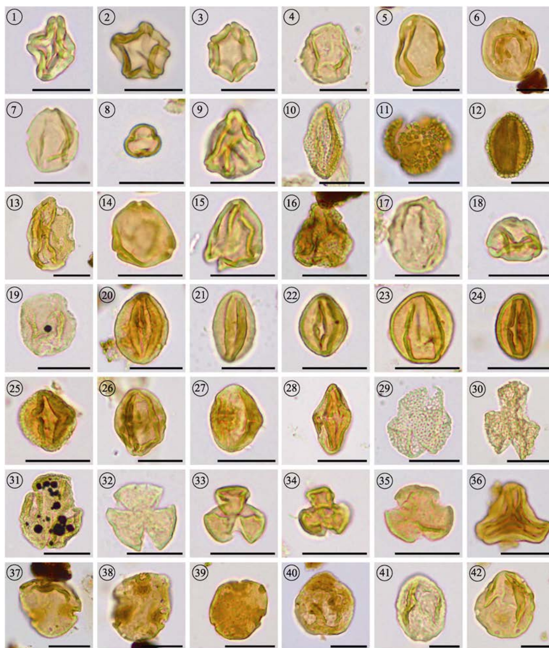
附录2-I 普阳煤矿剖面常见孢粉属种 I (比例尺=20 μm)