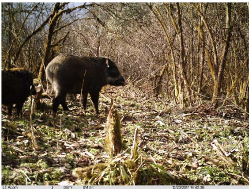
野猪 Sus scrofa