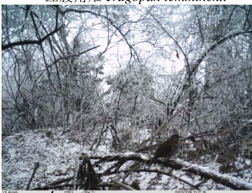
四川淡背地鸨 Zoothera griseiceps