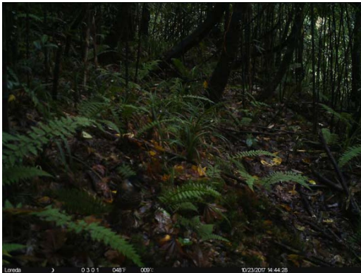
眼纹噪鹛 Garrulax ocellatus