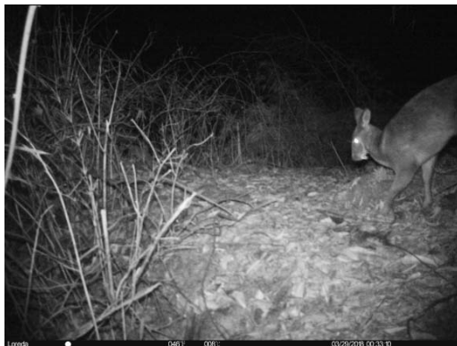
林麝 Moschus berezovskii