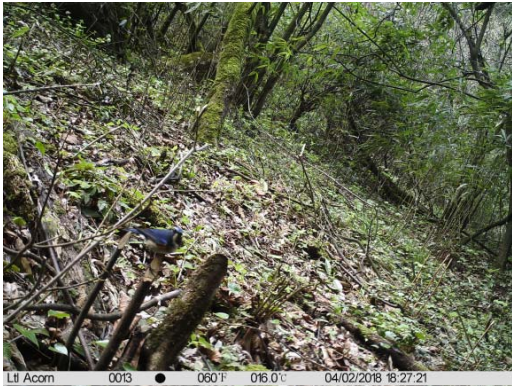
蓝眉林鸫 Tarsiger rufilatus