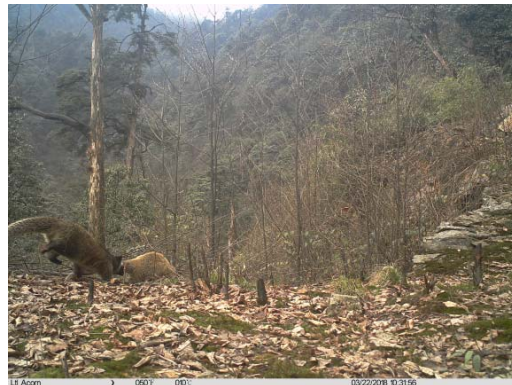
果子狸 Paguma larvata