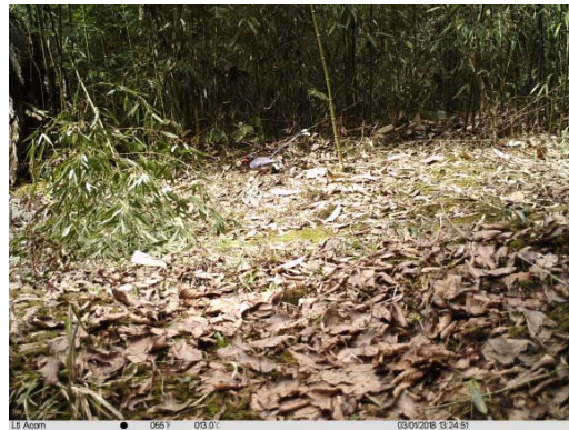
红嘴蓝鹊 Urocissa erythroryncha