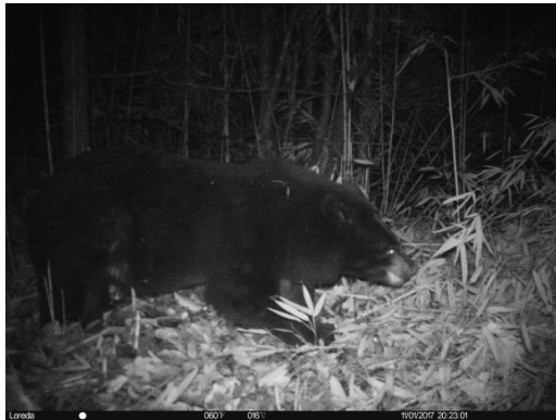
黑熊 Ursus thibetanus