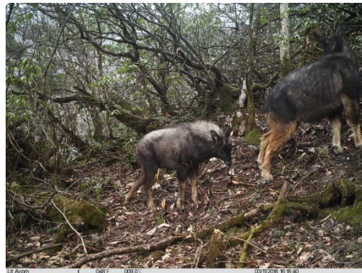
中华鬣羚 Capricornis milneedwardsii