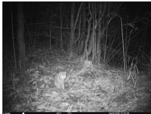
豹猫 Prionailurus bengalensis