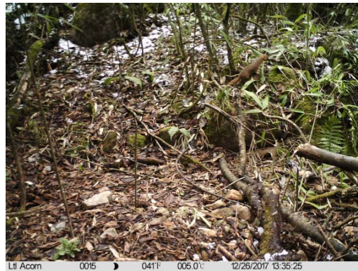
黄鼬 Mustela sibirica