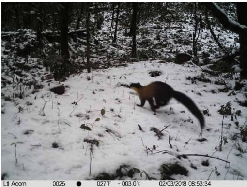
黄喉貂 Martes flavigula