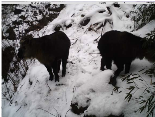
四川羚牛 Budorcas tibetanus