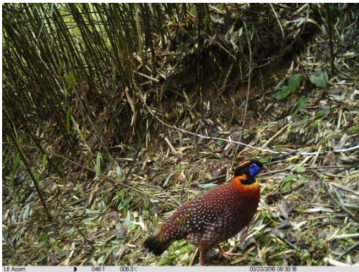
红腹角雉 Tragopan temminckii