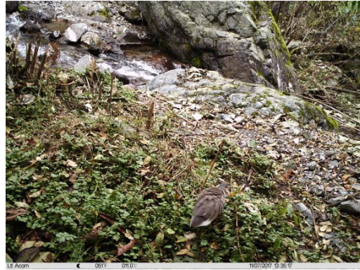
池鹭 Ardeola bacchus