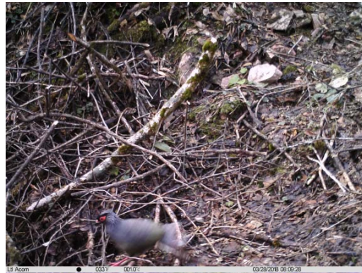
血雉 Ithaginis cruentus