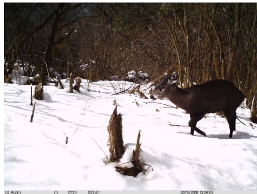
毛冠鹿 Elaphodus cephalophus