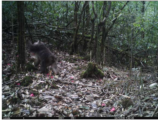
藏酋猴 Macaca thibetana