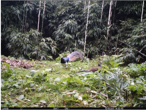
白腹锦鸡 Chrysolophus amherstiae