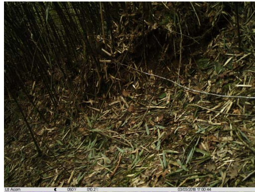
棕颈钩嘴鹛 Pomatorhinus ruficollis