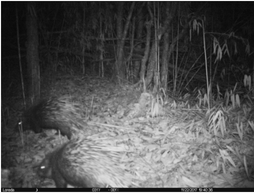
中国豪猪 Hystrix hodgsoni

刘鹏, 付明霞, 齐敦武, 宋心强, 韦伟, 杨婉婧, 陈玉祥, 周延山, 刘家斌, 马锐, 余吉, 杨洪, 陈鹏, 侯蓉. 利用红外相机监测四川大相岭自然保护区鸟兽物种多样性. 生物多样性, 2020, 28 (7): 905–912. http://www.biodiversity-science.net/CN/10.17520/biods.2019381