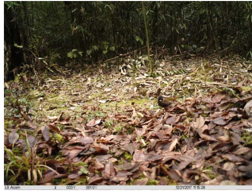
黑顶噪鹛 Trochalopteron affine