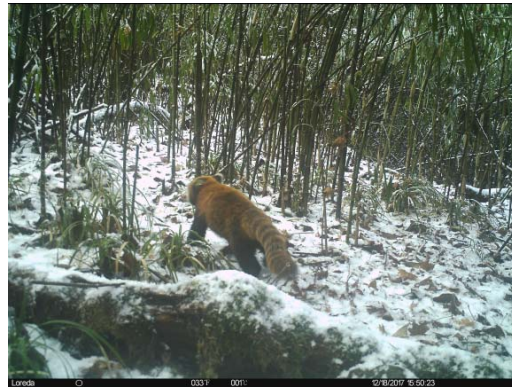
小熊猫 Ailurus fulgens