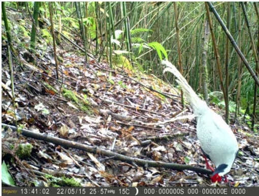
白鹇 Lophura nycthemera