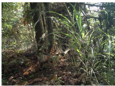
白眉鸫 Eyebrowed Thrush