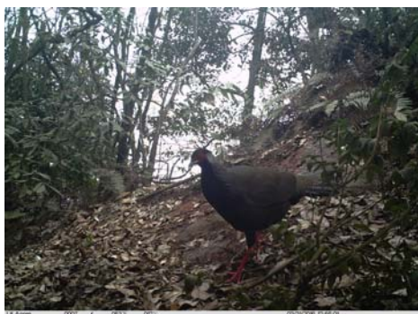
白鹇 Lophura nycthemera