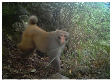
猕猴 Macaca mulatta