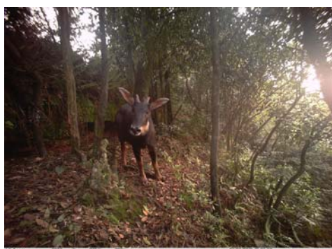
中华鬃羚 Capricornis sumatraensis