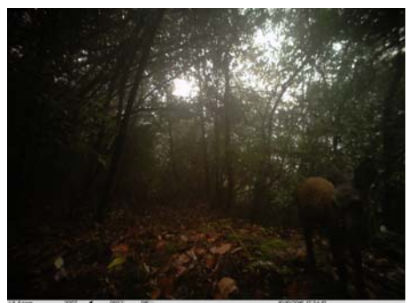
林麝 Moschus berezovskii