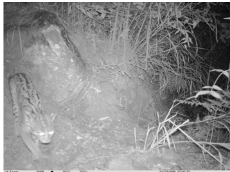
豹猫 Prionailurus bengalensis