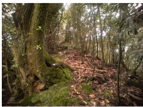
黑喉噪鹛 Garrulax chinensis