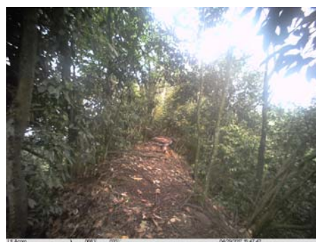
鹰雕 Nisaetus nipalensis