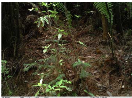
画眉 Garrulax canorus