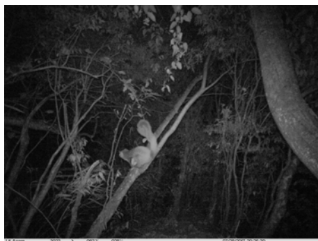
红白鼯鼠 Petaurista alborufus