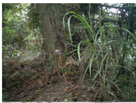
赤腹松鼠 Callosciurus erythraeus