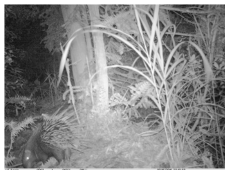
豪猪 Hystrix brachyura