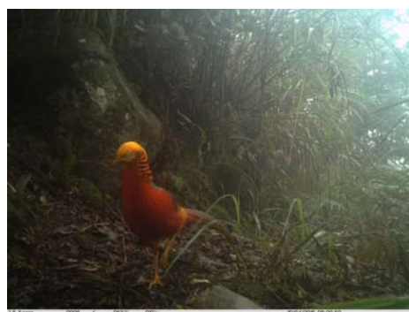
红腹锦鸡 Chrysolophus pictus