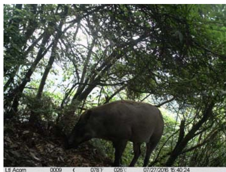
野猪 Sus scrofa