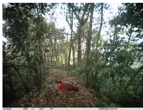
红腹角雉 Tragopan temminckii