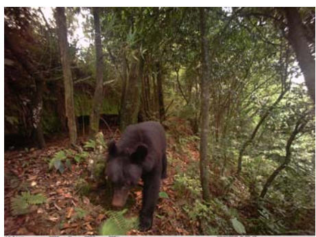
黑熊 Ursus thibetanus