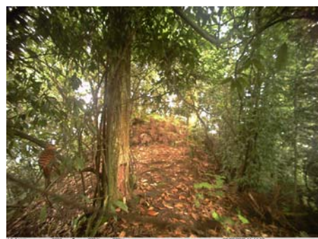
黄嘴栗啄木鸟 Blythipicus pyrrhotis