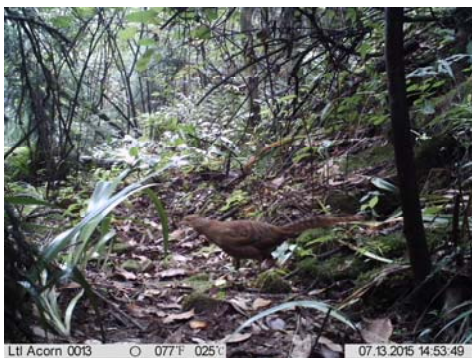
白腹锦鸡 Chrysolophus amherstiae