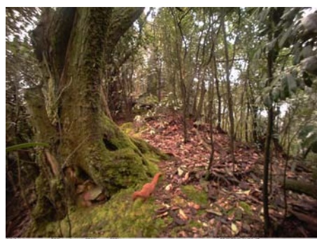
黄腹鼬 Mustela sibirica